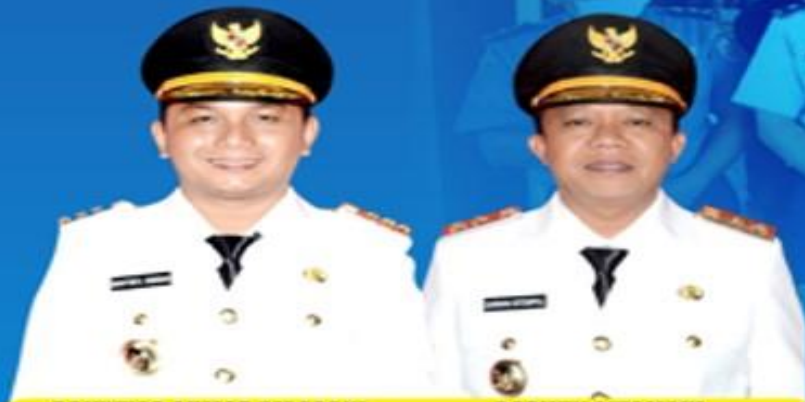
BAKHTIAR AHMAD SIBARANI BUPATI TAPANULI TENGAH

UPDATE DATA PASIEN PADA TANGGAL 17 JUNI 2020